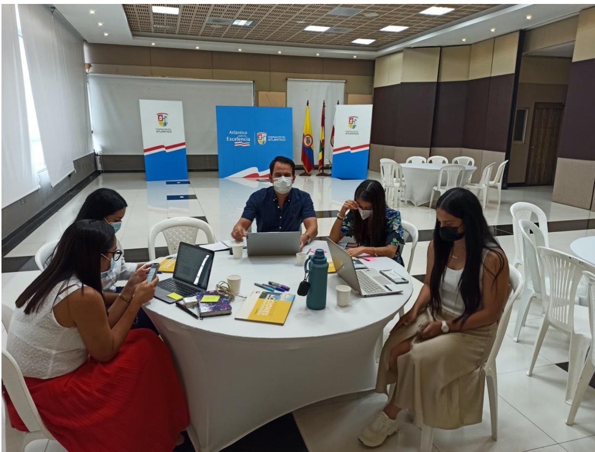
Figura 1. Visita presencial para socialización y desarrollo de la visión de descarbonización en Atlántico