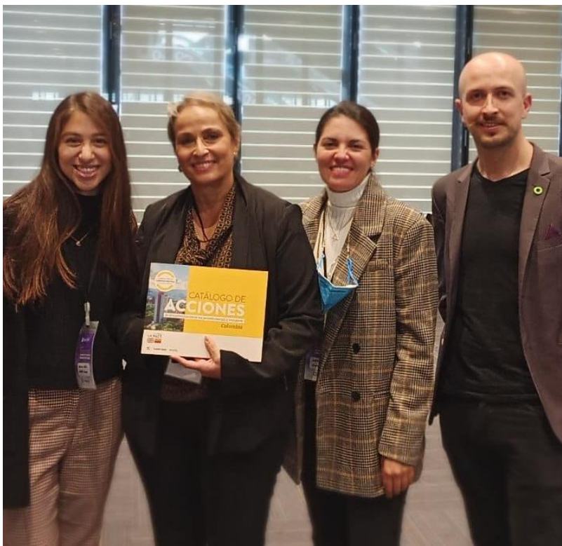
Figura 2. Involucrando al Sector Privado por medio de la Secretaria Técnica de la Comisión Regional de Competitividad e Innovación